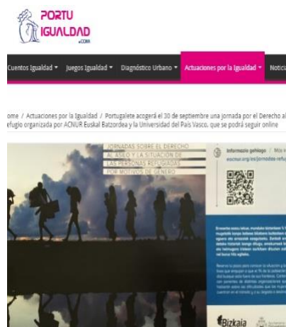
PORTUGALETE ACOGERÁ EL 30 DE SEPTIEMBRE UNA JORNADA POR EL DERECHO AL REFUGIO ORGANIZADA POR ACNUR EUSKAL BATZORDEA Y LA UNIVERSIDAD DEL PAÍS VASCO, QUE SE PODRÁ SEGUIR ONLINE